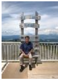
美しが原高原 絶景