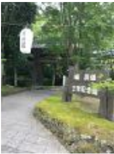
追分宿 堀辰雄記念館