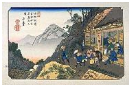
溪斎英泉 奈良井宿