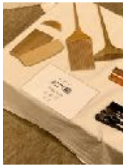
お六櫛 江戸検で習ったよ