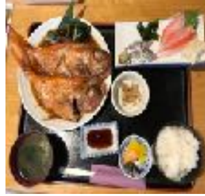
【金目鯛づくし 旨し！】